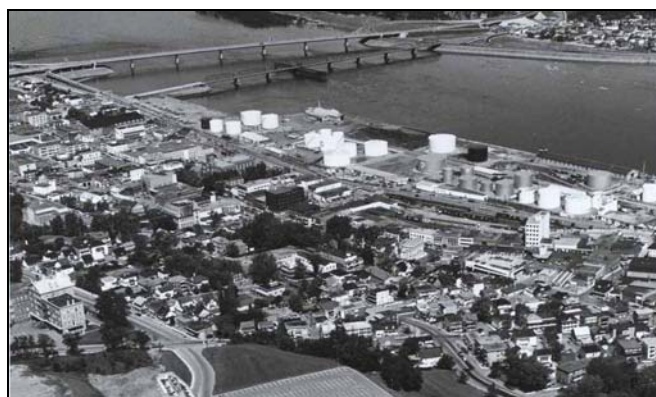
Fig. 2 – Utilisation du sol au centre